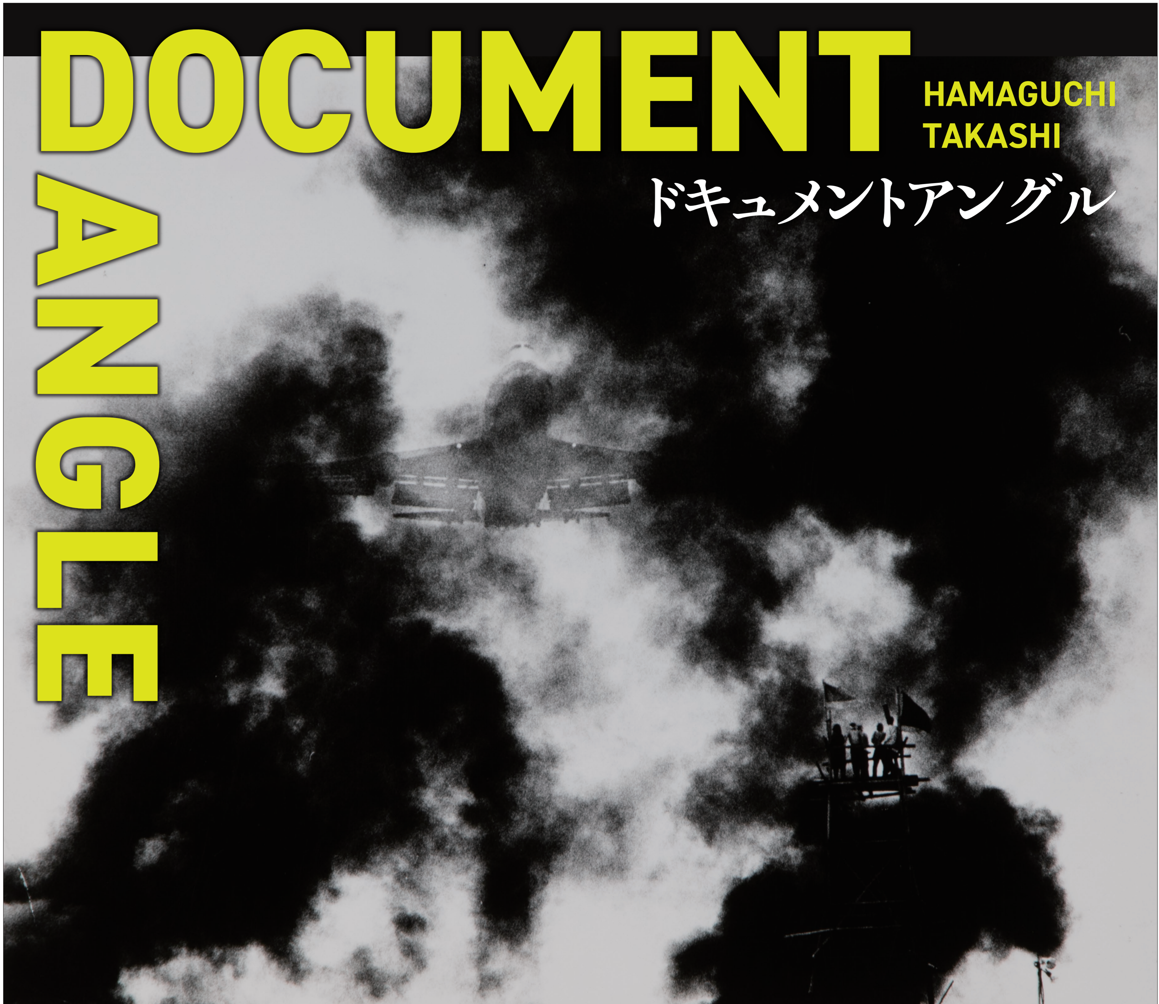
三里塚成田闘争(黒煙の中、YS-11機の初飛行テスト)(1977年5月7日)