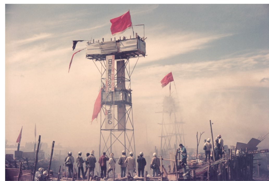
第2次強制執行の騎野野營 1971年9月16日